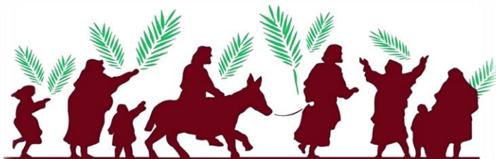
Hosana Davidovu Sinu: Blagoslovljen koji dolazi u ime Gospodnje! Kralju Izraelov: Hosana u visini!

Hosana, vikahu, u visini! Kad je čuo narod da Isus dolazi u Jeruzalem, iziđoše mu u susret.